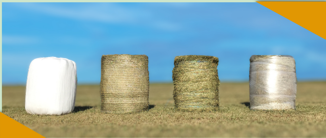
Fardo de pré-secado Plastificador PHS 550