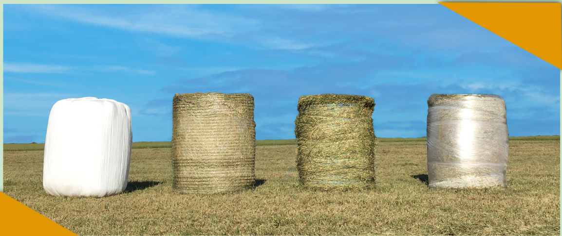
Fardo de pré-secado Plastificador PHS 550